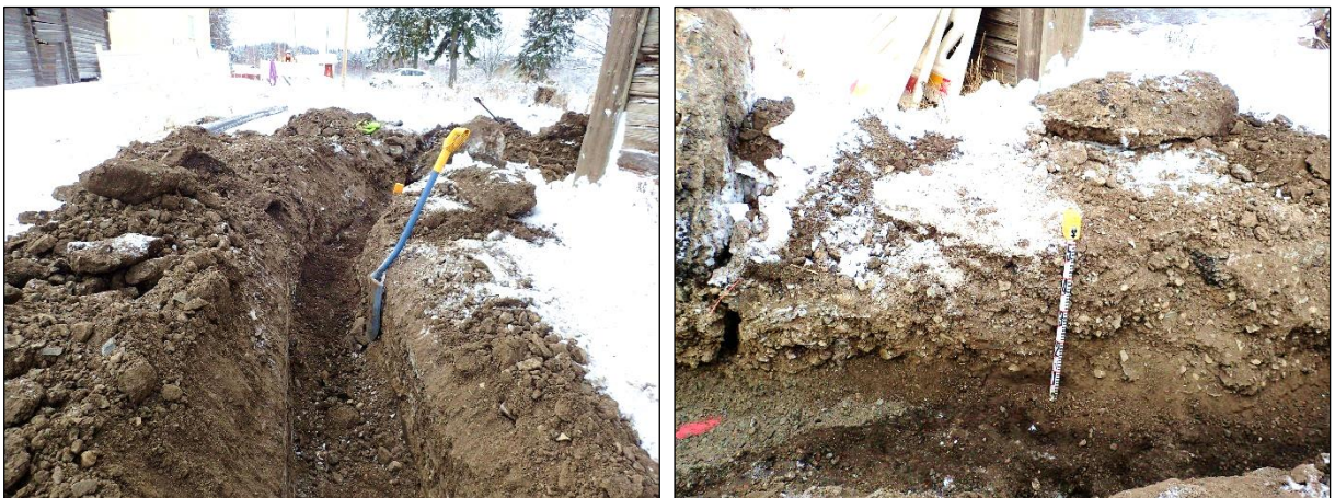
Vasen: havaintokohta 5. Selkeä kulttuurikerros alkaa lapion kohdalta ja jatkuu aitan kulman yli. Lounaaseen. Oikea: havaintokohta 5. Kulttuurikerros on noin 50 cm tiekerrosten alla. Luoteeseen.

Sen sijaan aitan kaakkoiskulman kohdalla (joulukuun havaintokohta 5) nyt tehdyt havainnot poikkesivat hieman joulukuun havainnoista. Havaintojen eroavaisuuteen vaikutti se seikka, että joulukuun valvonnassa ojaa ei tällä kohtaa kaivettu määräsyyvyteen (50 cm). Tuolloin valvontahavaintojen perusteella tulkittiin siten, että havaintokohtien 4 ja 5 välillä on yhtenäinen kulttuurikerros. Nyt tehtyjen havaintojen perusteella paikalla on kulttuurikerrosta 2,4 metrin matkalla, pisteiden N 6818092 E 316625,3 ja N 6818090,7 E 316623,3 välisellä matkalla. Tämä kulttuurikerroksen osuuden päällä on 50 cm nykyaikaisia tiekerroksia (asfalttia, soraa). Kulttuurikerros on tummaa, liki mustaa, ilmeisesti noen värjäämää savista maata. Kerroksen pintaa puhdistettiin lastalla, minkä yhteydessä sen pinnalta todettiin muutamia tiilen tai palaneen saven muruja sekä satunnaisia pieniä kiviä ( \emptyset max. 10 cm). Löytäjä ei talletettu valvonnan yhteydessä. On mahdollista, että havaintokohtien 4 ja 5 välillä on kulttuurikerrosta yli 50 cm syvyydessä, mihin ei siis kaivettu joulukuussa 2018 eikä tammikuussa 2019.