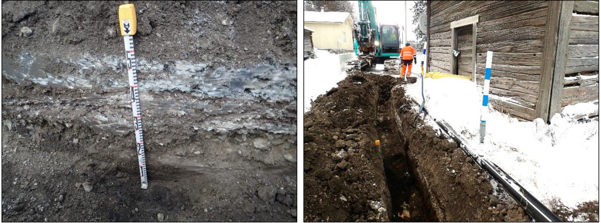
Vasen: tumma kulttuurikerros näkyy mitan nro 1 kohdalla. Täältä kohtaa (havaintokohta 3 ja 4) ei kaivettu tätä syvemmälle. Tumma kerros otettiin kuvassa näkyvän verran esille lapiolla. Oikea: Mitan yläosa pilkottaa kuvan vasemmasta laidasta: mitta on vasemman puoleisen kuvan otto paikalla. Lounaaseen.

Sen sijaan aitan kaakkoiskulman kohdalla (joulukuun havaintokohta 5) nyt tehdyt havainnot poikkesivat hieman joulukuun havainnoista. Havaintojen eroavaisuuteen vaikutti se seikka, että joulukuun valvonnassa ojaa ei tällä kohtaa kaivettu määräsyyvyteen (50 cm). Tuolloin valvontahavaintojen perusteella tulkittiin siten, että havaintokohtien 4 ja 5 välillä on yhtenäinen kulttuurikerros. Nyt tehtyjen havaintojen perusteella paikalla on kulttuurikerrosta 2,4 metrin matkalla, pisteiden N 6818092 E 316625,3 ja N 6818090,7 E 316623,3 välisellä matkalla. Tämä kulttuurikerroksen osuuden päällä on 50 cm nykyaikaisia tiekerroksia (asfalttia, soraa). Kulttuurikerros on tummaa, liki mustaa, ilmeisesti noen värjäämää savista maata. Kerroksen pintaa puhdistettiin lastalla, minkä yhteydessä sen pinnalta todettiin muutamia tiilen tai palaneen saven muruja sekä satunnaisia pieniä kiviä ( \emptyset max. 10 cm). Löytäjä ei talletettu valvonnan yhteydessä. On mahdollista, että havaintokohtien 4 ja 5 välillä on kulttuurikerrosta yli 50 cm syvyydessä, mihin ei siis kaivettu joulukuussa 2018 eikä tammikuussa 2019.