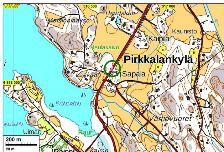
Valvonnassa kaivettu alue sijoittuu kartan keskelle, vihreän ympyrän sisäpuolelle.

Tulokset: Valvonnan aikana avattiin uudelleen joulukuussa 2018 kaivettu kaapelioja Sapalan aitan itäpuolella, Anian rantatien kohdalla. Maakaapeli asennettiin tien kohdalle arkeologin valvonnassa jo joulukuussa havaittujen kulttuurikerrosten päälle. Kaivannon peittämisen jälkeen maakaapelin asennus lopetettiin aitan eteläpuolelle, tieojaan. Tässä vaiheessa (02/2019) ei ole tietoa siitä, milloin kaapelointia jatketaan.